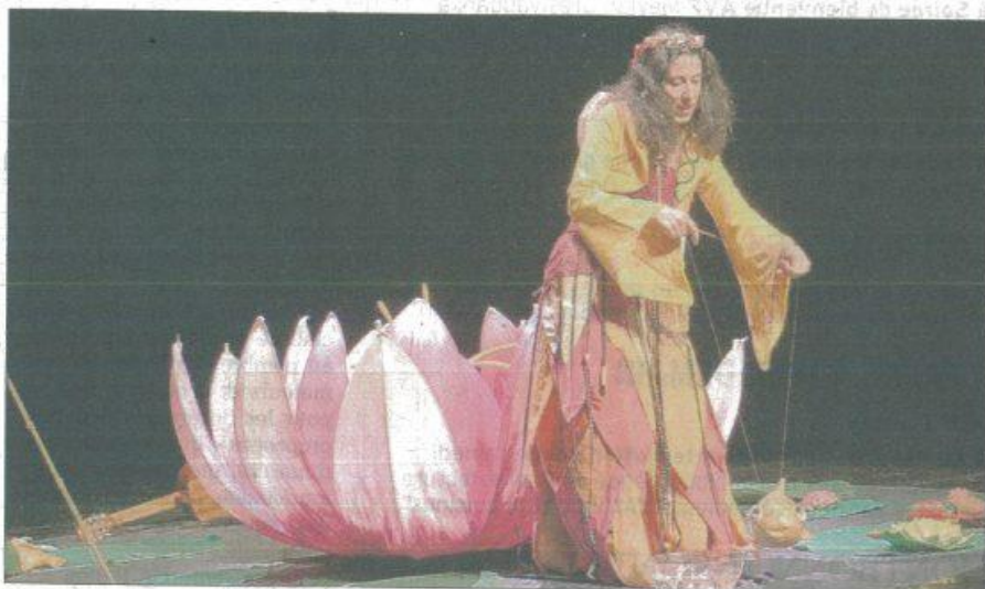
C.P. Dora a su captiver son jeune public avec un spectacle parfaitement adapté aux tout-petits.

Une jolie parenthèse enchantée pour un public conquis par la douceur et la présence de Dora qui a su parfaitement communiquer son plaisir de chanter et de partager. Après une demi-heure sans bruit, les apprentis spectateurs ont remercié Dora par des applaudissements chaleureux et mérités. La fée de l'eau a réussi son tour de chant.