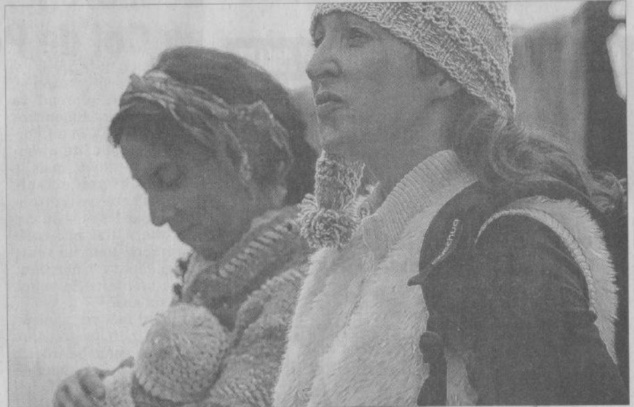
70 personnes dont les enfants du centre de loisirs de la MJC de Crolles ont assisté à la représentation sur l'amitié dans la différence, la tolérance et le respect de l'autre.

Un autre spectacle est prévu aujourd'hui avec un concert de compositions originales Caicedo à 18 h 30 au Kedreos 23. Entrée libre et participation au chapeau. Annulation si très forte pluie.