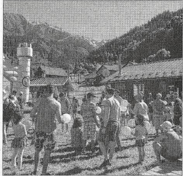
Entre randonnée, contes, poneys, tir-à-l'arc, sackline, géocaching et spectacle sur le peuple Mapuche, la récré des mômes a attiré de nombreux participants.

Après cette description de la "récré des mômes", certains enfants doivent être déçus de n'avoir pu participer. Qu'ils se consolent, ils peuvent noter que le "Festi mômes" aura lieu au Pley-net le 7 août prochain. Encore une belle fête en perspective.