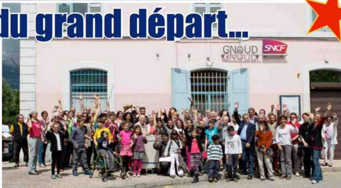
Au départ d'un grand voyage, sur le quai de la gare de Bri...gnoud.

Etape 1 à Bruxelles, où après quelques avant-premières à Bernin et Crolles, ils pourront présenter leur spectacle. Ensuite, ils voleront jusqu'à Moscou. C'est là-bas que les choses sérieuses vont commencer, avec deux concerts et deux spectacles au théâtre du jardin botanique de Moscou, l'un des plus grands jardins botaniques d'Europe (130 hectares) et surtout au Conservatoire Tchaïkovski de Moscou, l'école de musique la plus importante et la plus prestigieuse de la capitale, sinon de toute la Russie. Ils feront dans ces lieux emblématiques où vit l'âme russe, leurs premières rencontres de passeurs de culture, leurs premiers films et leurs premiers enregistrements sonores. De quoi alimenter le contenu du site Internet de leur projet : lespasseursdecultures.com où leur périple pourra être suivi en détails durant