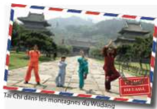
Tai Chi dans les montagnes du Wudang