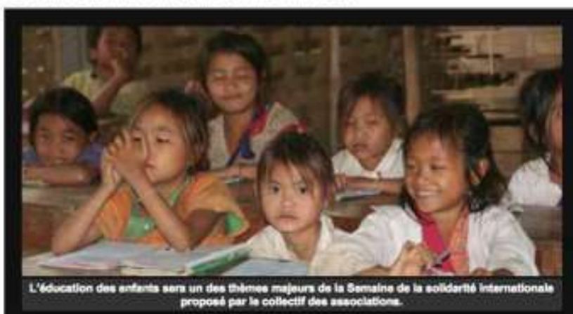
L'éducation des enfants sera un des thèmes majeurs de la Semaine de la solidarité internationale proposé par le collectif des associations.