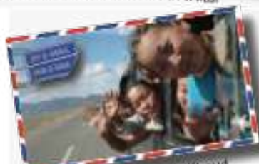
Mongolie : sur la route de Khovd