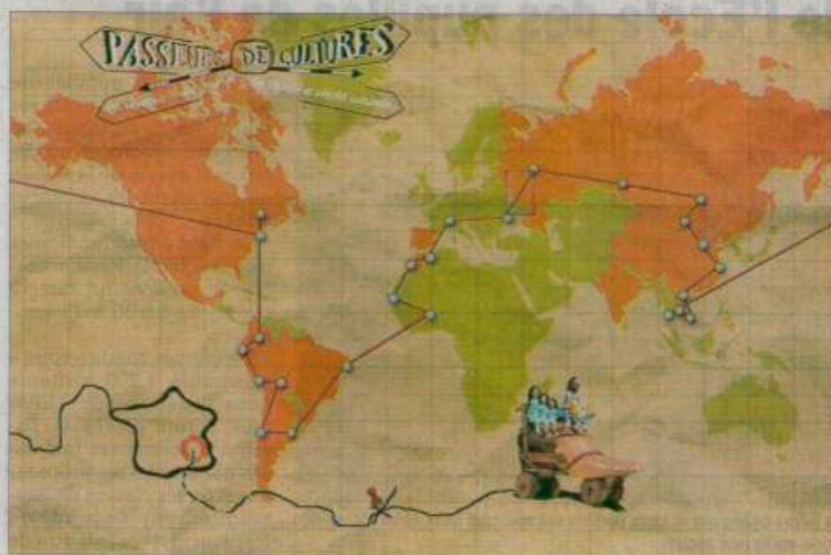
Le parcours permettra de découvrir les artistes sur quatre continents.

Le parcours de 14 mois affiche 50 000 km environ dont : 16 000 km en train (dont le fameux Transsibérien), 6 000 en bus (principalement en Amérique du sud avec la fameuse Panaméricaine de la Colombie au Chili) et 28 000 km en avion (pour les connexions intercontinentales). Le bilan carbone sera entièrement compensé par une action de reboisement dans la région Mapuche au Chili. Au total, quatre continents et 17 pays seront visités dans cet ordre : Ukraine (Kiev et Sebastopol)- Russie (Moscou, Perm, Irkoutsk)- Mongolie (Ullan Bator)- Chine (Pékin et Shanghai) - Vietnam (Ho Chi Minh et Ha Noi)- Cambodge (Phnom Penh)- Laos (Vientiane)- USA (New York)- Canada (Montreal/Québec)- Colombie (Bogotá/Cali)- Bolivie (La Paz)-