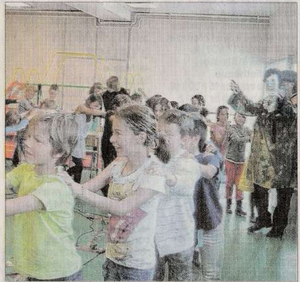
Une ronde conviviale et spontanée avec tous les protagonistes