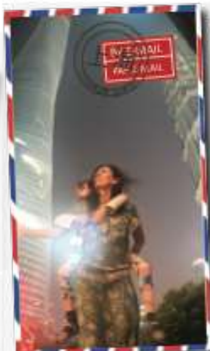
Au pied des tours de Shanghai