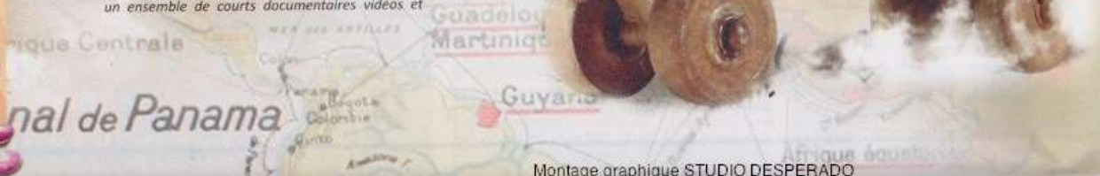
Montage graphique STUDIO DESPERADO