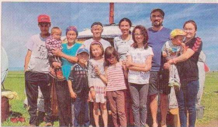
Les Latil ont rencontré une famille mongole dans la steppe...