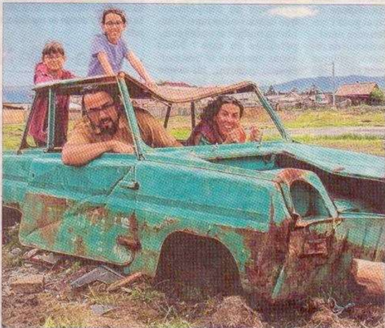
... Un peu plus tôt, ils avaient emprunté le Transsibérien à la découverte de la vie russe, jusque dans le quotidien des écoliers.